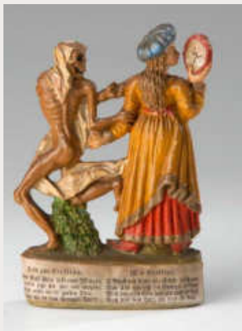
Totentanz, Zizenhausener Terrakotte, um 1822 (Dreiländermuseum)

Veranstalter: Evangelischer Kirchenbezirk Markgräflerland Ort: Dreiländermuseum