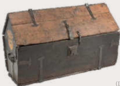
Satteldachtruhe von 1559 (Dreiländermuseum)

Veranstalter: Evangelischer Kirchenbezirk Markgräflerland Ort: Dreiländermuseum