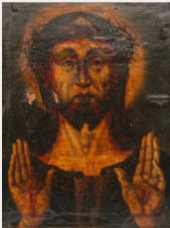
Andachtsbild mit Christusdarstellung, Ende 15. Jh. (Dreiländermuseum)

Veranstalter: SAK Zeit&Wissen Lörrach Ort: Dreiländermuseum