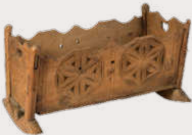
Kinderwiege von 1560 (Dreiländermuseum)

Veranstalter: VHS beider Basel Ort: Haus der Vereine Riehen, Folgetermine am 6.11. in Riehen und am 13.11. im Dreiländermuseum