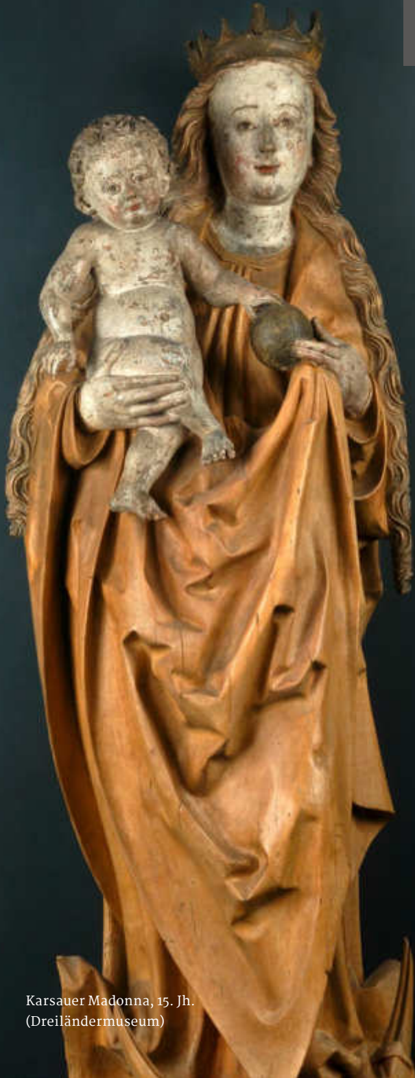
Karsauer Madonna, 15. Jh. (Dreiländermuseum)