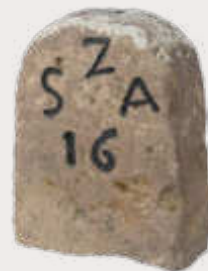
Güterstein des Basler Klosters St. Alban (Dreiländermuseum)

Treffpunkt: DITIP-Moschee Lörrach, Spitalstraße 51.