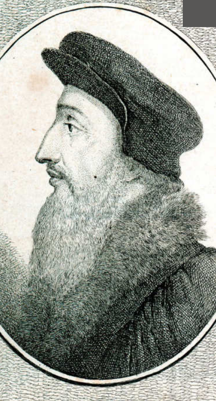
Ökolampad, der Reformator von Basel (Dreiländermuseum)