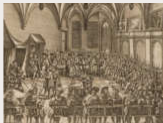
Bekennnis der Lutheraner auf dem Reichstag in Augsburg 1530 (Dreiländermuseum)

Ort: Lörrach, Bar Drei König, Basler Str. 169