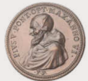
Papst Pius V. (Dreiländermuseum)

Veranstalter: Gruppe Abraham Ort: Dreiländermuseum