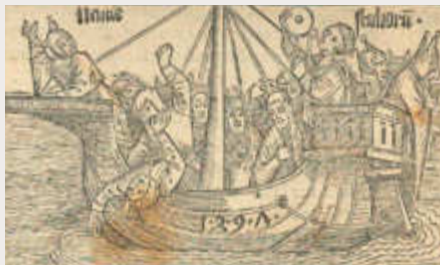
Narrenschiff von Sebastian Brant, Elsass 1497 (Dreiländermuseum)

Veranstalter: Stadt Lörrach, PlusPunktZeit