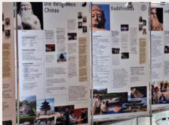
Begleitausstellung im Hebelsaal