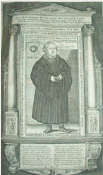
Bildnis Martin Luthers in einer Bibel von 1645 (Dreiländermuseum)