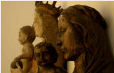
Karsauer und Dinkelberger Madonna, 15. Jh. (Dreiländermuseum)