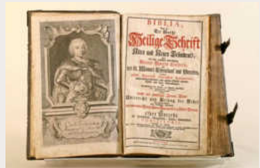
Luther-Bibel, 1748 von einem Glaubensflüchtling in Lörrach gedruckt (Dreiländermuseum)

Veranstalter: Evangelischer Kirchenbezirk Markgräflerland Ort: Stadtkirche Schopfheim