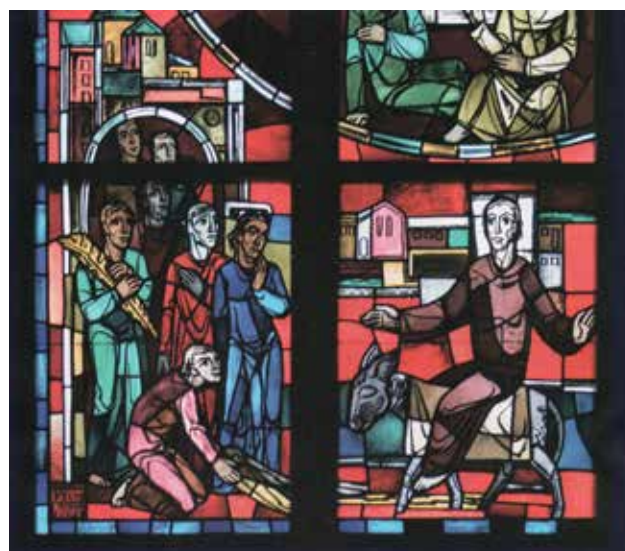
Ausschnitt Chorfenster Stiftskirche Stuttgart, Rudolf Yelin

Aber auch allein können Sie eintauchen in die Texte und Meditation.